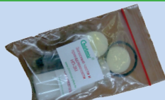
▲ Комплект ЗИП